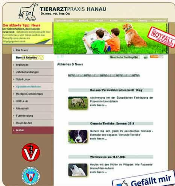
www.Tierinfo-Hanau.de: Neuigkeiten aus der Praxis oder aus dem Umfeld finden Sie hier oder unter www.facebook.de/TierarztpraxisHanau